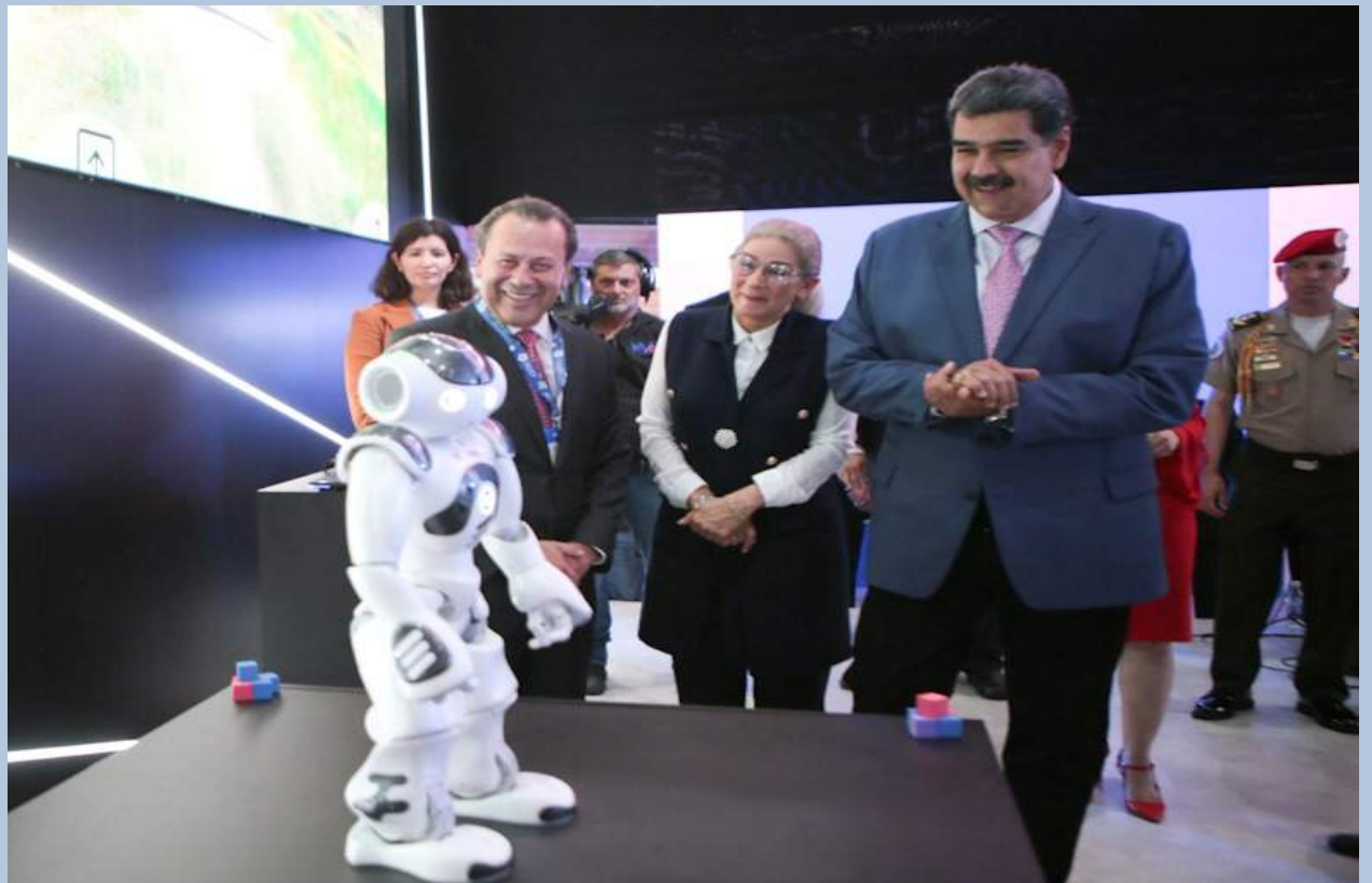
La tarde de este miércoles, el presidente de la República, Nicolás Maduro Moros, inaugura la I Feria Internacional de Telecomunicaciones "Fitelven" 2023, en el Poliedro de Caracas, ubicado en La Rinconada, en Caracas