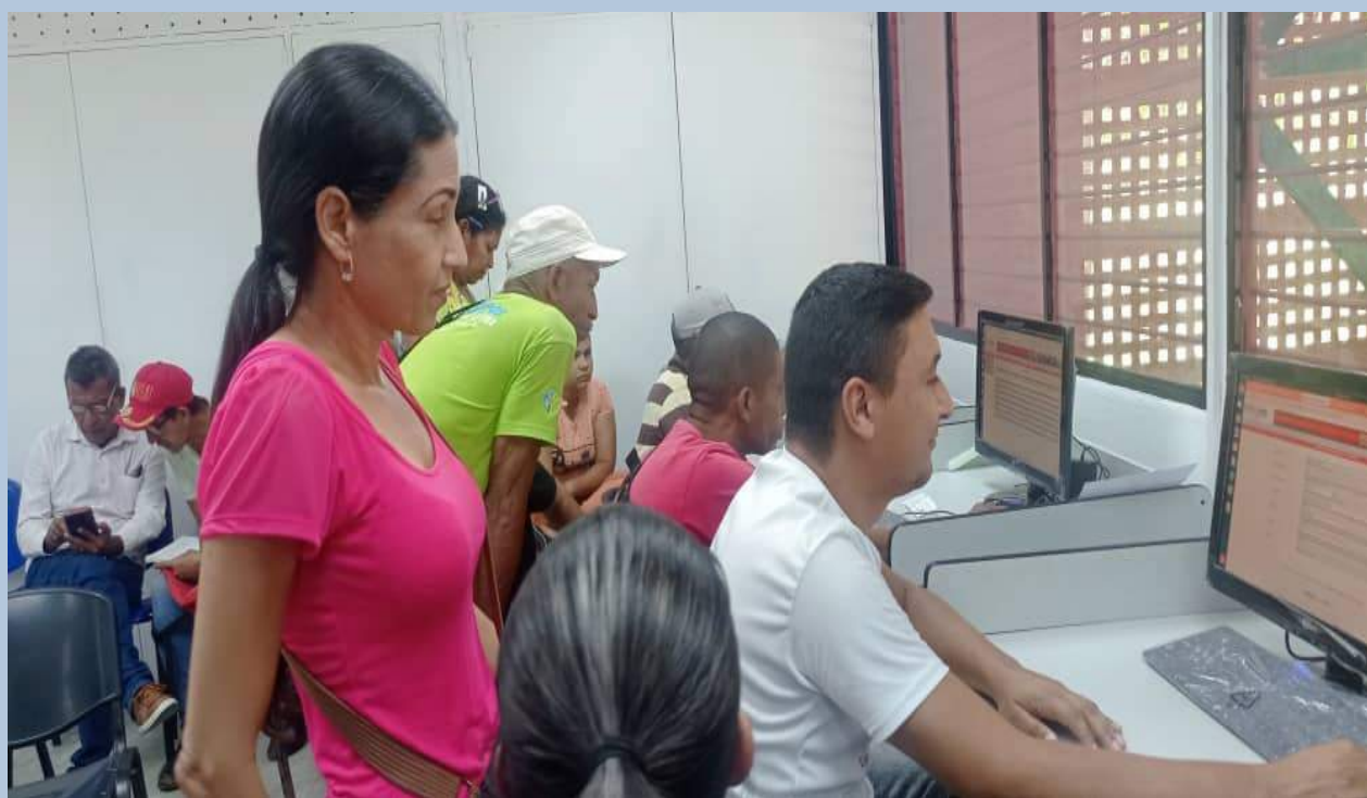
La Jornada de Registro se realizo con el apoyo del poder popular del sector