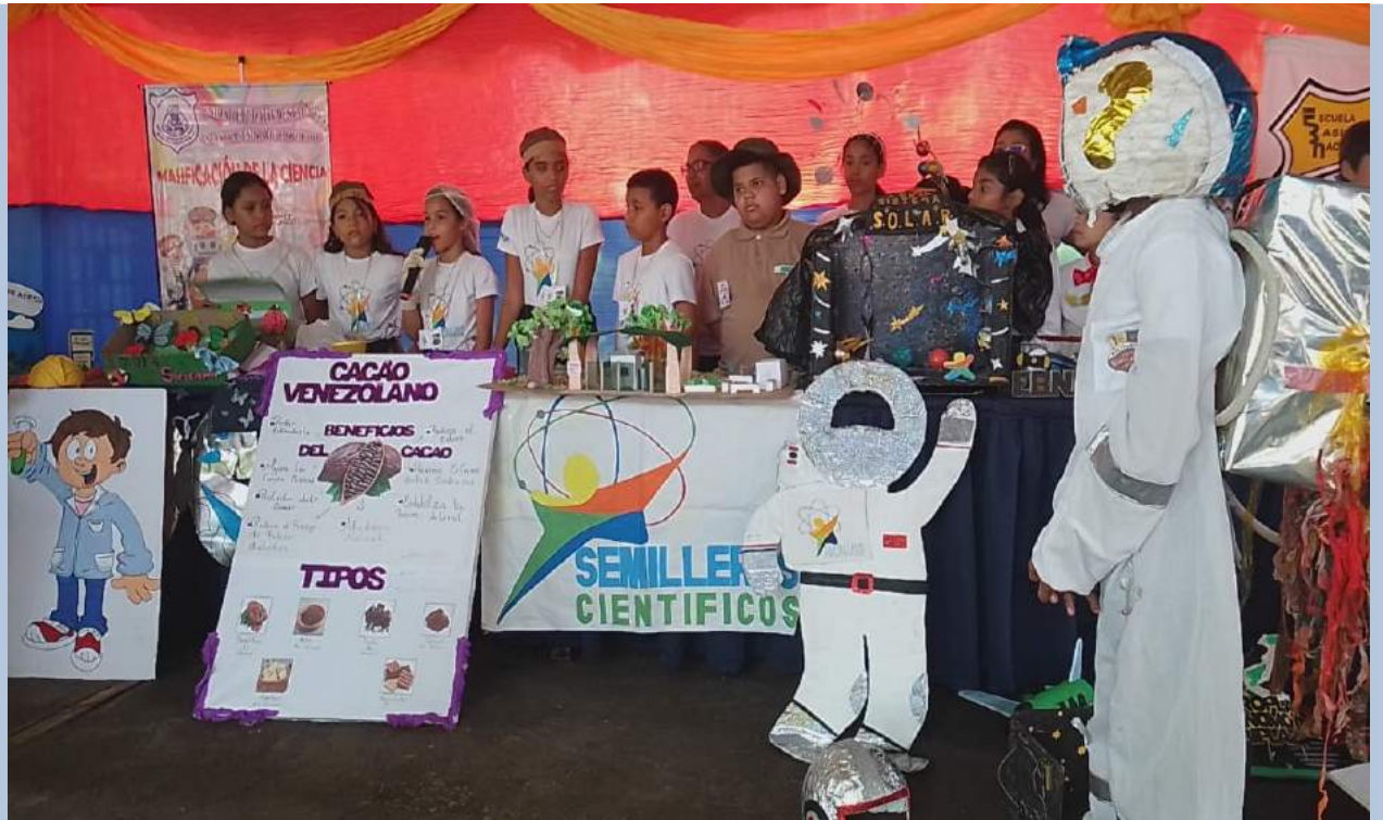
Instituciones Educativas se dieron cita en el Encuentro de Cierre de la Ruta Científicas