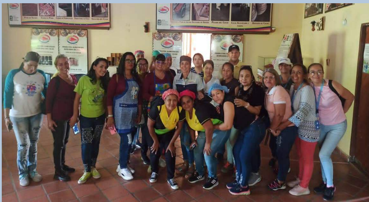
Docentes de las formaciones de semilleros científicos dijeron presente en e taller

Este Miércoles, el equipo promotor de robótica se reunió en la sede de Fundacite Aragua, para definir estrategias para el desarrollo del ENCuentro ESTUDIANTIL DE ROBÓTICA INNOVANDO Y CREADO HACIA LA EDUCACIÓN DEL FUTURO. Con la participación de los Entes Adscritos al Ministerio de Ciencia y Tecnología (MINCYT) Fundación Infocentro y Fundacite Aragua, de igual manera por el Ministerio del Poder Popular para la Educación Fundabit, Cenamed, y responsable de formación de la ZEA. Este encuentro tendrá un proceso de Inscripción de pequeños científicos que ya tengan un proyecto realizado a través de este enlace https://forms.gle/HYjc1H4mVvj25fM39 .