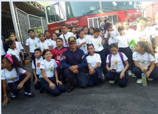
El recorrido en las instalaciones del cuerpo de bomberos del estado Aragua