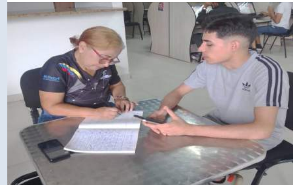
Foto cortesía: Los estudiantes ofrecen formaciones tecnológicas al poder popular

Con el apoyo institucional que ofrece la Fundación Infocentro, Estudiantes del Universidad Politécnica del estado Aragua (UPTA) en La Victoria, solicitaron el apoyo al infocentro del Municipio Ribas, para realizar Proyecto Comunitario denominado "Mantenimiento Preventivo y Correctivo de los Equipos".