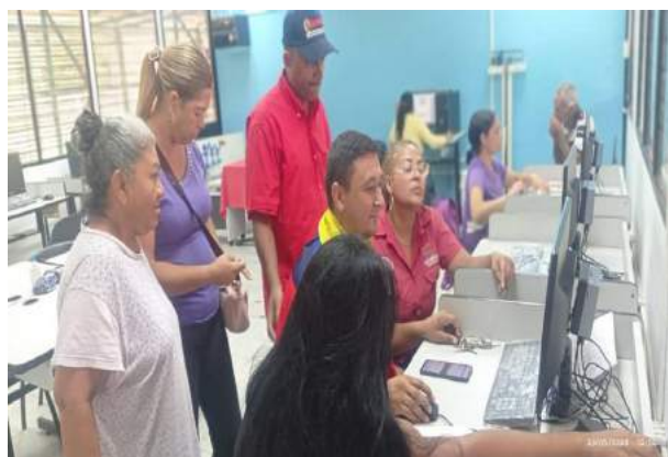
Infocentro sigue empoderando al Pueblo de las Tecnologías de Información y Comunicación