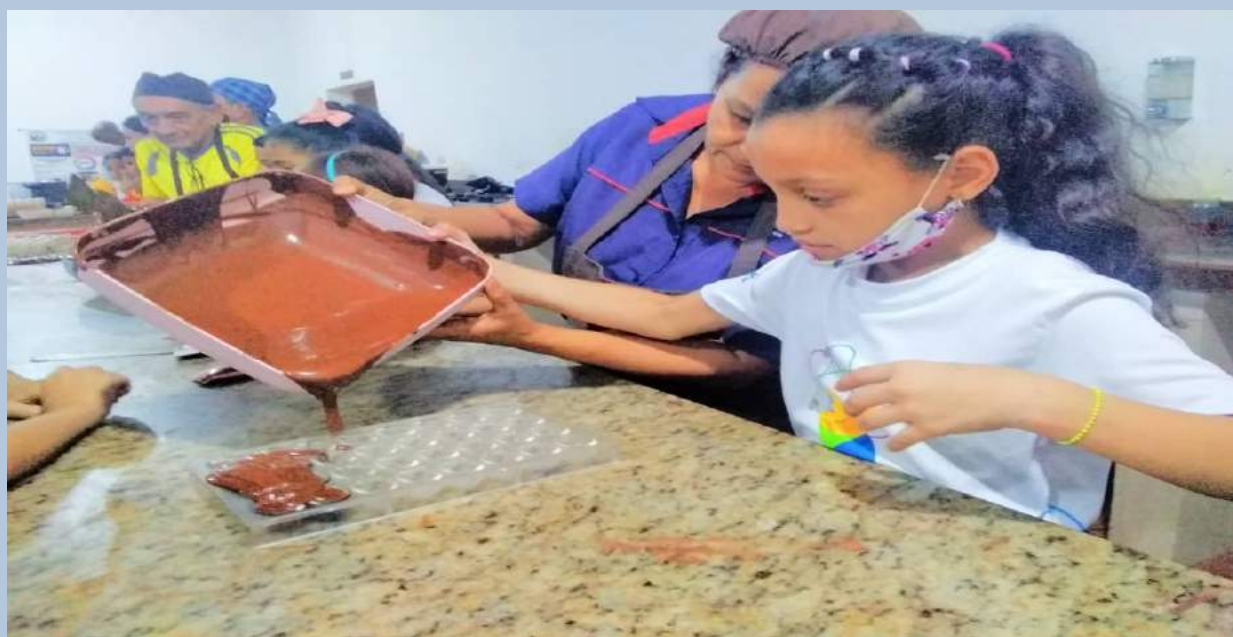
Estudiantes de la Unidad Educativa Madre Maria de San Jose realiza formación para fortalecer sus conocimientos.